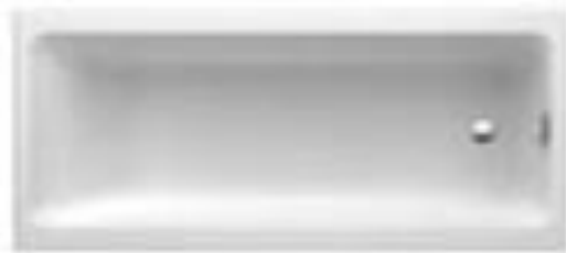
Badewanne Modell Prisma Venus

Eine schöne Badewanne ist das Herzstück des Bades und macht es zum Ort der Entspannung.