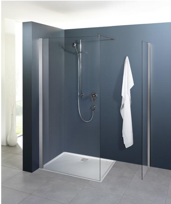
Beispiel für Dusche im Flacheinbau

Schön und sinnvoll – flach eingebaute Duschtassen sind eine elegante und zeitgemäße Lösung im modernen Bad.