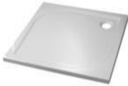
Prisma Apollo 900x900 mm

Schön und sinnvoll – flach eingebaute Duschtassen sind eine elegante und zeitgemäße Lösung im modernen Bad.